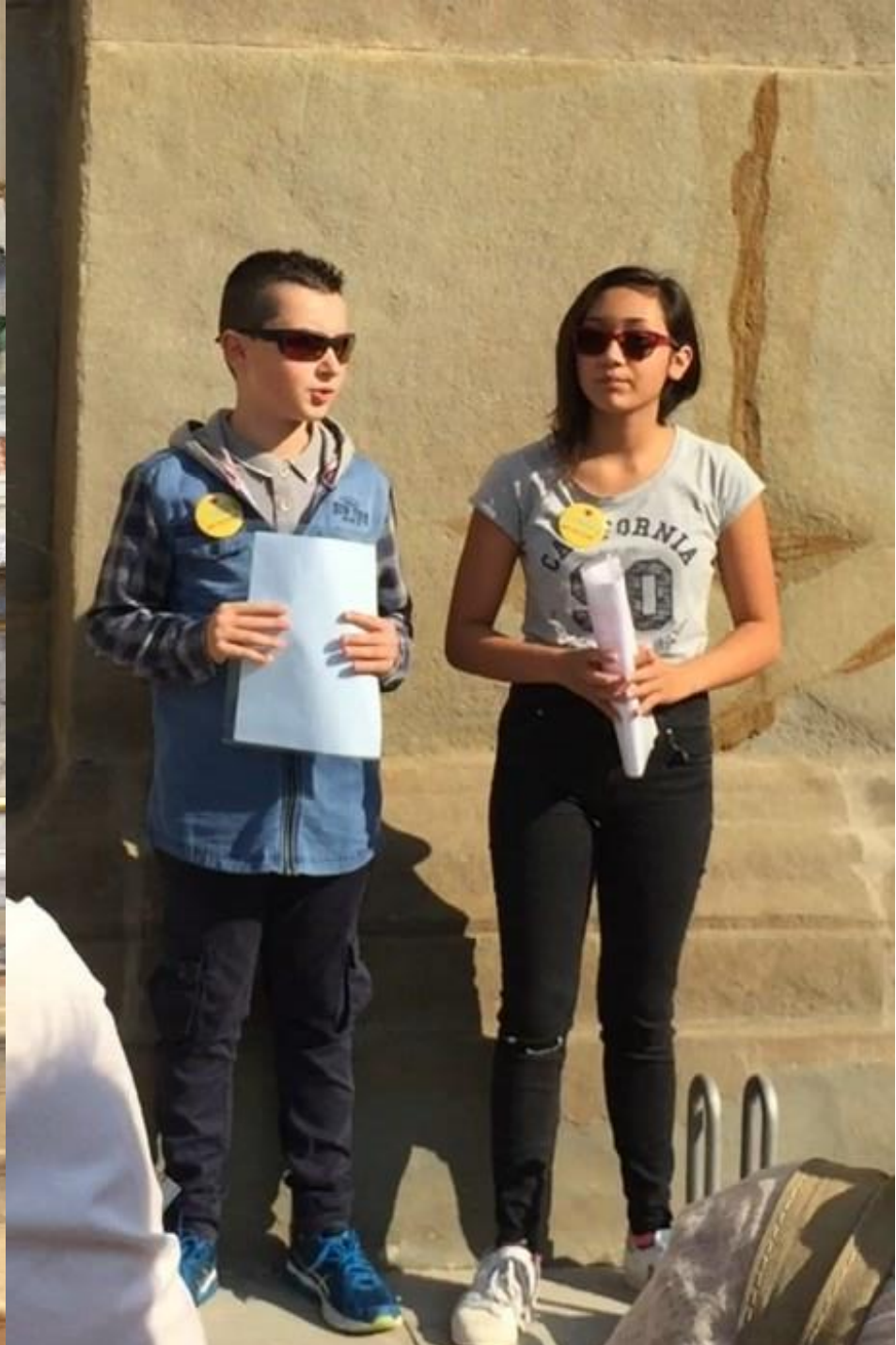
Quattro " Apprendisti Ciceroni " della Chiesa di San Giorgio