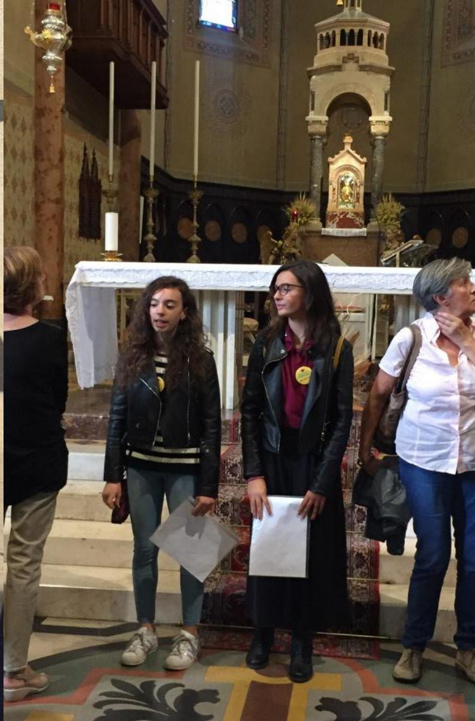
Quattro "Apprendisti Ciceroni" della Chiesa Parrocchiale