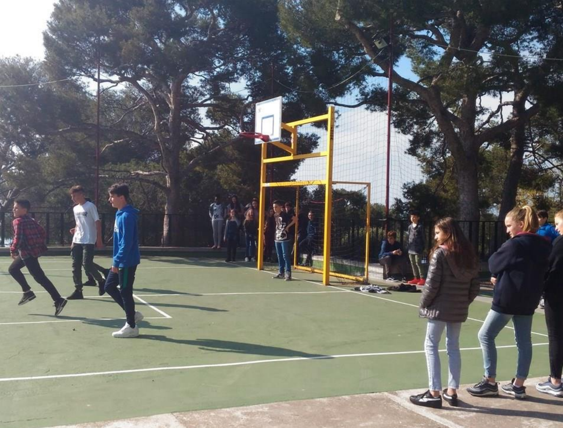
Alcuni momenti di svago durante l'intervallo.....