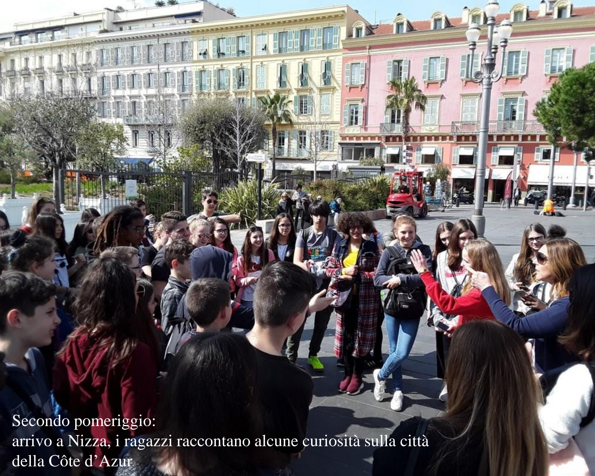
Secondo pomeriggio: arrivo a Nizza, i ragazzi raccontano alcune curiosità sulla città della Côte d'Azur