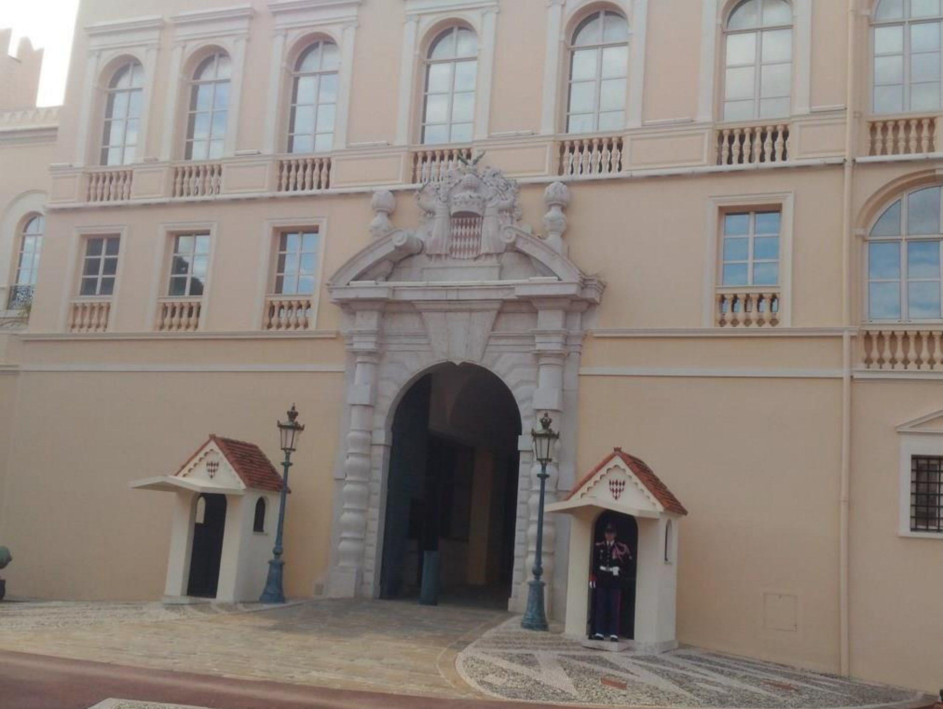
Visita al Palazzo dei Principi, residenza ufficiale del principe di Monaco.