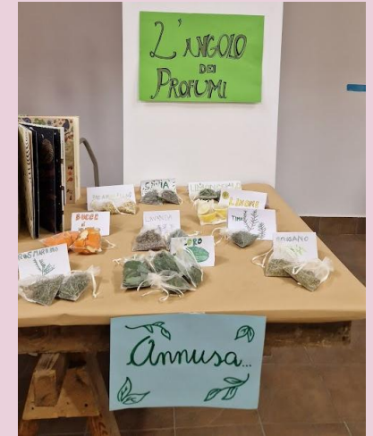
Questa la “CASA COMUNE” con gli elementi della natura suggeriti dal CANTICO DELLE CREATURE DI SAN FRANCESCO D’ASSISI .